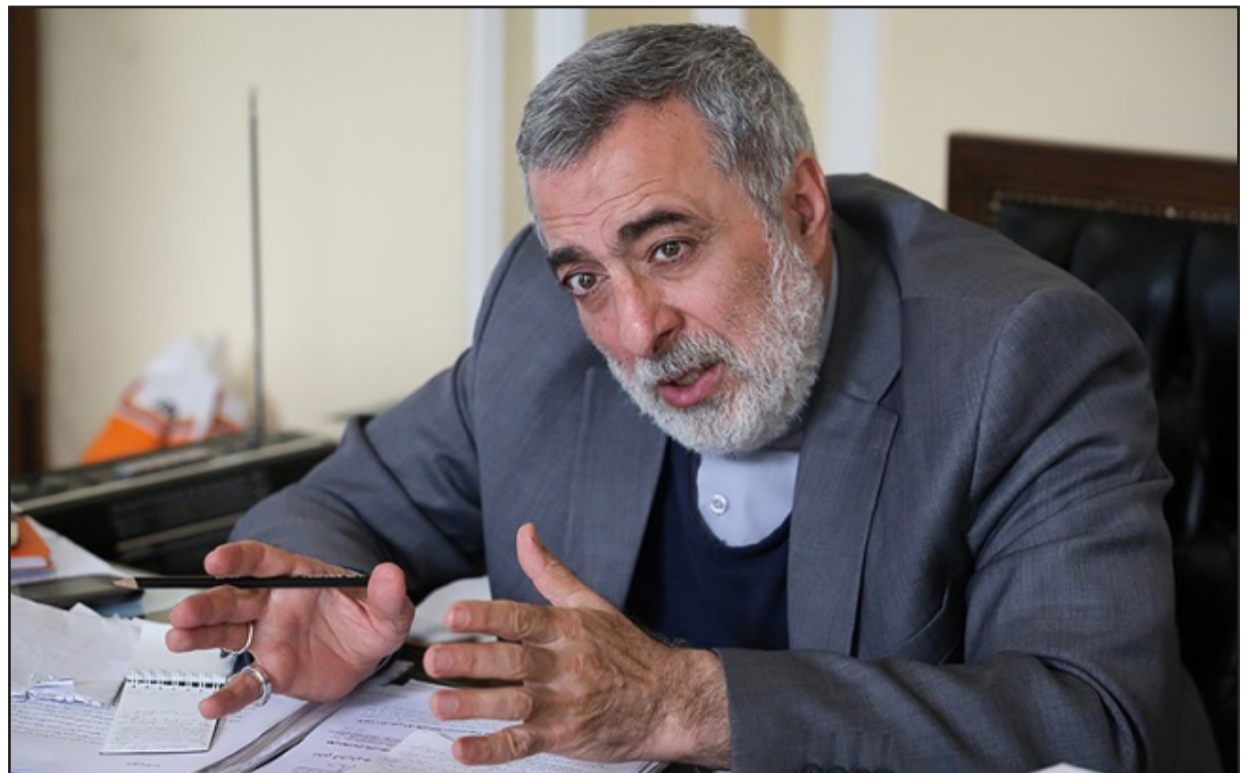
تواند داشته باشد؟

بر مبنای این اشتباه محاسباتی یک حمله ای را شروع کرد که الان به صورت یک بحران برای آنها تبدیل شده است.