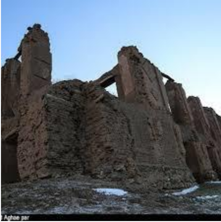
maku eskeri hastane

"Alınca ırmağının Aras'a döküldüğü yerde bulunan bu belde, Azerbaycan ve İsfahan bölgesinde iki kasabadan meydana gelen şehir mühim bir ticaret merkeziydi. İran Culfa'sı veya Yeni Culfa denilen kasabadan bir müddet tedavi edilen Milis Albayı Said Nursî buradan Tiflis'e sevk edilen diğer esir askerlerle beraber Tiflis'e gelmişlerdi."