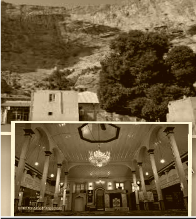
konusu geçen eski cami