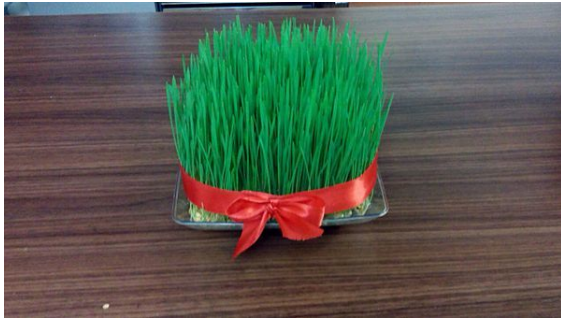
NOWROUZ-navroz- 4shanbeh suri 13bedar