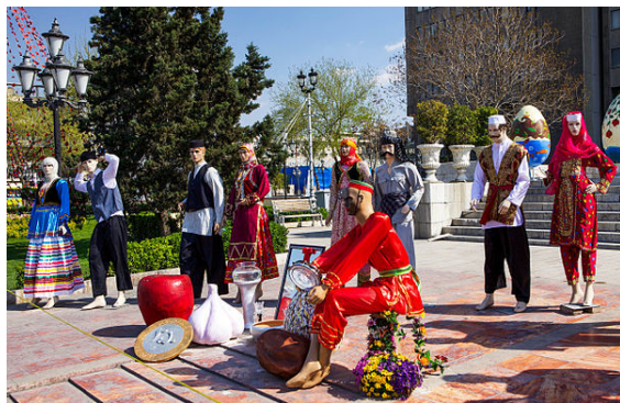
پوشش اقوام ایرانی و سفره هفت سین در میدان توپخانه

نوشتار اصلی: جغرافیای جشن نوروز منطقه‌ای که در آن جشن نوروز برگزار می‌شود، امروزه شامل چند کشور