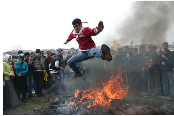
برگزاری مراسم آتش‌بازی در میان کردها در شهر استانبول، ترکیه

لباس نو و حمام رفتن بوده است، مردان و زنان قبل از فرارسیدن نوروز به حمامهای زنانه و یا مردانه می‌رفتند و شلوغ‌ترین روزهای گرمابه‌ها، همان چند روز سال نو بود. در گرمابه های قدیمی که معمولاً با چوب و هیزم در (گرخانه) Gor Khaneh یا (آتش خانه) آب داخل خزانه را که بر روی دیگهای بزرگ قرار داشتند گرم می‌کرد، حمامی ها لازم بوده که یک ذخیره ویژه چوب و هیزم را برای روزهای نوروز ذخیره کنند.