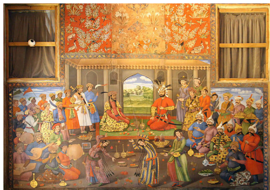
جشن نوروزی شاه طهماسب به افتخار همایون شاه هند Humayun

کردها نیز این جشن را در فاصله میان ۱۸ تا ۲۱ مارس جشن می‌گیرند. بنظر کردها قیام کاوه آهنگر و پیروزی او بر ضحاک را جشن نوروز نامیده اند. در هنگام نوروز، کردها با گردهم‌آیی در بیرون شهرها، به استقبال بهار می‌روند. در این گردهم‌آیی‌های نوروزی، زنان کرد لباس‌های رنگین پوشیده