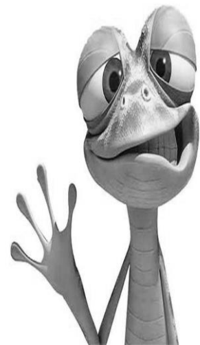
پچه ها کارتوون عالی پود